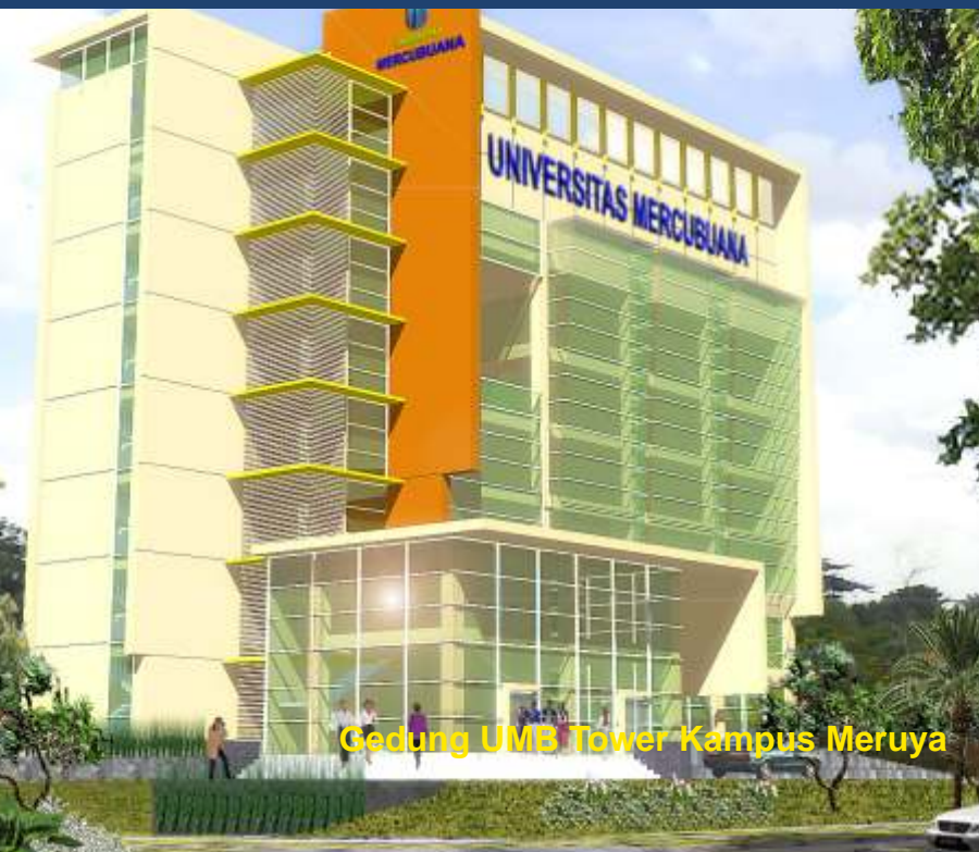
Gedung UMB Tower Kampus Meruya